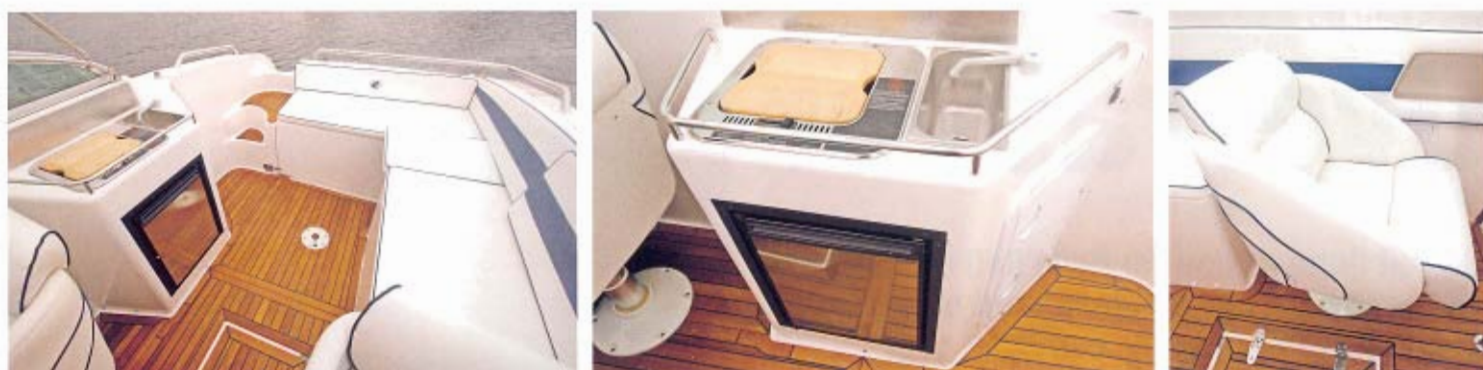
God plads i cockpittet og gangzone til badeplatform. Mange siddepladser, men hynderne er for tynde. Kompakt og funktionelt pantry. Flotte stole.

til venstre for rattet og ikke i sigtelinjen. Vi går ud fra, at der ved placeringen er taget hensyn til, at der skal være plads til GPS/kortplotter foran rattet. Fint nok, men fladen giver kun plads til mindre skærme. I bredden er også plads til et ekkolod. Ud over dette fungerer førerpladsen helt fint - også når man står op. Styringen er imidlertid i den tungere ende.