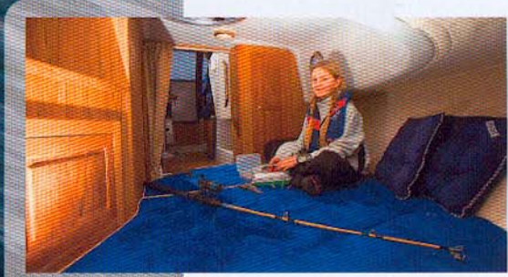
I kahytten forude er der forbavsende god plads til den, som vil sove godt i ferien eller blot weekenden.

Det er først inde i styrehuset, eller rettere sagt, midtsalonen, at man føler sig rigtig godt tilpas om bord i 805 Commuter. Oversigten er glimrende, og man sidder rigtig godt i førersædet, hvor pudsen også kan løftes op for god støtte. For en voksen mand er førersædet ideelt, mens en fyr på mindre end 1,80 m nok vil ønske en stol, hvor højden kan reguleres.