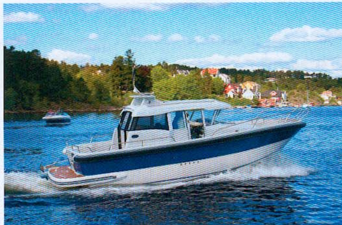
Askeladden Commuter er designet af slovenske JJ Design, som bruger meget avanceret computerteknik til deres konstruktioner og udfræsning af utrolig nøjagtige plugs, hvorover formene bygges.

Med langt mindre plads og kun otte længdemeter til rådighed har Askeladden produceret en båd, som gør det sikkert at sejle ud selv i dårligt vejr, og samtidig har skipper og mandskab/passagerer nem tilgang til hele båden med god