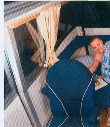
Siddegruppen og bordet agter i styrehuset kan let ændres til en rimelig dobbeltkøje.