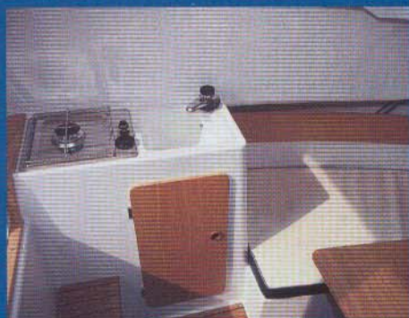
Pantry-sektionen med blus, vask og skab.