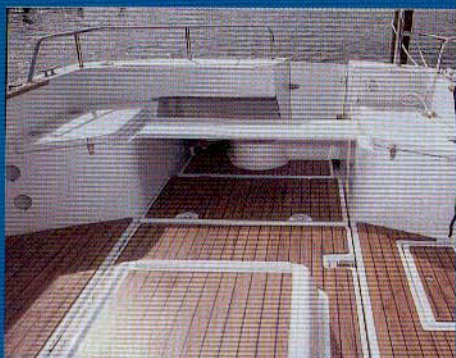
Fjernes bænken agter, kan man stå og fiske.

håndgreb de rigtige steder og med en ordentlig fortojningspullert i stævnen. Der er adgang til badeplatformen, ekstra ud-