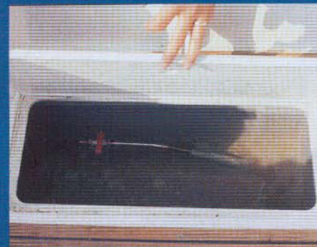
Fiskedammen, hyttefadet, er standard.