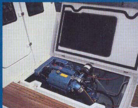
Det er nemt at servicere motoren.