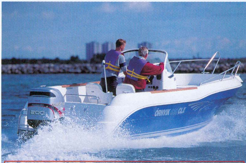
200 hk gør 630'eren til noget af en raket, men den kan sagtens nøjes med under det halve.