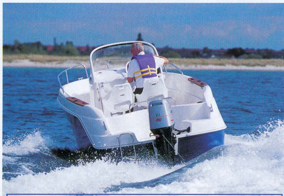
60 hk danner en harmonisk enhed med 550'eren - Noter den gode dybde af walkaround'en.

Örnvik 550 var noget mere civiliseret udrustet med en 60 hk Mariner firetakter, og det var en fin og positiv overraskelse. Båden sejlede dejlig harmonisk, og hvis ikke man har behov for at sejle med mange passagerer ombord, er de 60 hk rigeligt. Med dem planer den omkring 11 knob og sejler i god balance fra 15-16 knob til topfarten omkring 27 knob. Harmoniske sejlegenskaber kan altså også opnås ved at holde igen i hestekraft-racet.